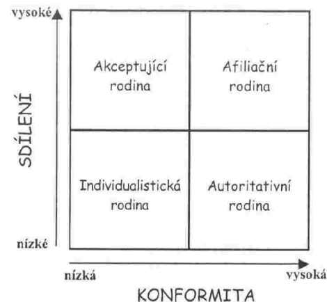
Obr. 2 Typy rodin podle míry orientace na přizpůsobení a orientace na sdílení

Naopak, u rodin, které jsou na konformitu orientovány minimálně , je komunikace zaměřena na různost postojů a přesvědčení, respektuje a reflektuje individualitu členů rodiny a jejich nezávislost. Je zdůrazňována rovnost všech členů rodiny a děti jsou často přizývány k rozhodování o různých věcech, které